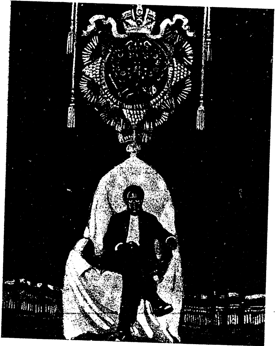
כאווער לוניאָל — א נענערשער דעלעגאט פון אמריקע זיצט אפן געוועזענעם צארישן טראָן אין קרעמל בעאייס א צוזאמענפאַר פון קאָמינטערן.